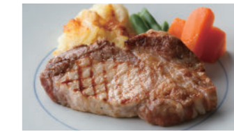
宮崎産南の鳥豚ロース (網焼き または ソテー) 2,910円