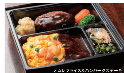
洋食ミックス弁当 2,800円 お好きな洋食2種・季節の小付・香の物付