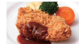
宮崎産南の鳥豚カツレツ (ロースまたはフィレ) 2,910円