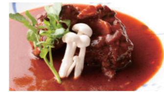
テールシチュー 4,970円