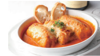
ロールキャベツのグラタン (トマトソース) 2,370円