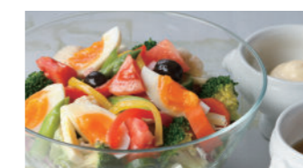
アングルサラダ (満天星ドレッシング) 1,940円