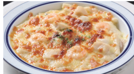
海の幸のマカロニグラタン/ドリア 2,160円