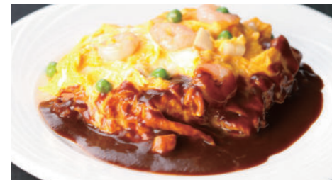
オムレツライス ドゥミグラス 1,940円 (5~9月は衛生の観点より提供中止とさせていただきます。)