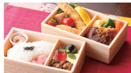
洋食二段弁当(フィレ) 3,670円 ステーキ・海老フライ・蟹クリームコロッケ・唐揚げ・焼魚・一品・香の物・付合・白飯・フルーツ ※写真はイメージです。内容が異なる場合がございます。