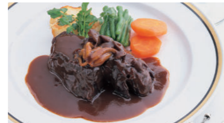
ビーフシチュー (ライス または パン付) 4,430円