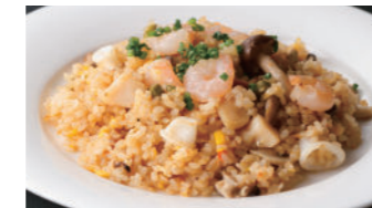
海の幸のピラフ 1,940円