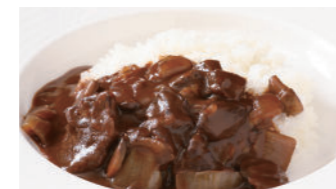
フィレビーフカレー 2,370円