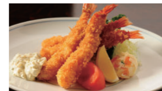
海老フライ タルタルソース 2,480円