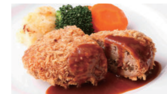
メンチカツ ドゥミグラス 2,480円