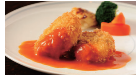
蟹クリームコロッケ 2,160円 たらば蟹クリームコロッケ 3,240円 (ライス または パン付)