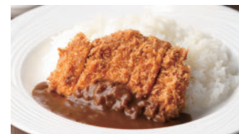
宮崎産南の鳥豚カツカレー 2,910円