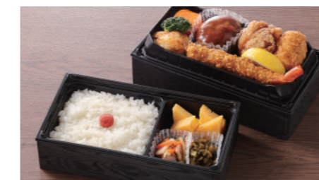
洋食弁当 1,950円 ハンバーグ・海老フライ・蟹クリームコロッケ・唐揚げ・一品・玉子焼・香の物・付合・白飯