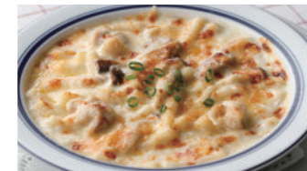
チキンと木の子 マカロニグラタン/ドリア 1,940円