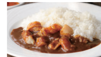
シーフードカレー 2,370円