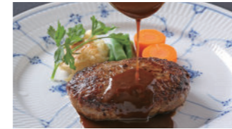
ハンバーグステーキ ドゥミグラス 2,480円