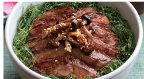
牛テキ井 2,910円 和牛テキ井 5,940円