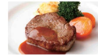
牛フィレステーキ 4,860円 和牛フィレステーキ 9,720円