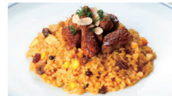
フィレビーフドライカレー 2,160円