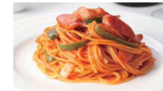
スパゲティ ナポリタン 1,860円