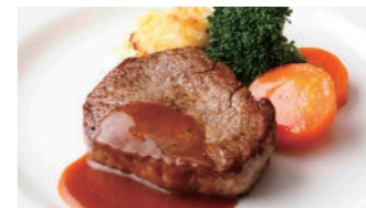
牛フィレステーキ 3,670円 和牛フィレステーキ 9,720円