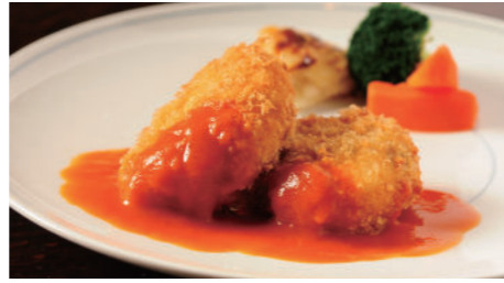
蟹クリームコロッケ 2,160円 たらば蟹クリームコロッケ 2,910円 (ライス または パン付)