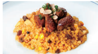
フィレビーフドライカレー 2,160円