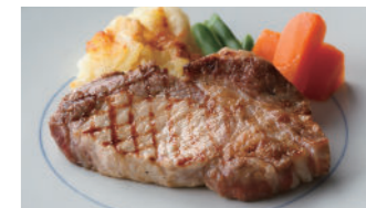
宮崎産南の島豚ロース (網焼き または ソテー) 2,160円