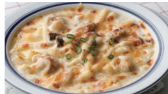
チキンと木の子のマカロニグラタン/ドリア 1,940円