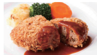
メンチカツ ドゥミグラス 2,050円