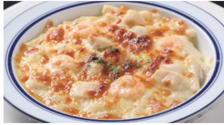
海の幸のマカロニグラタン/ドリア 2,160円