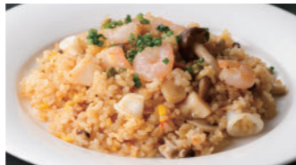
海の幸のピラフ 1,940円