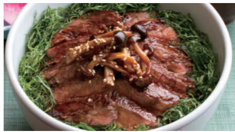
牛テキ井 2,380円 和牛テキ井 5,940円