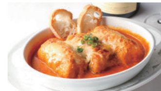
ロールキャベツのグラタン (トマトソース) 1,940円