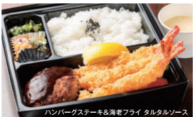
ハンバーグステーキ&海老フライ タルタルソース