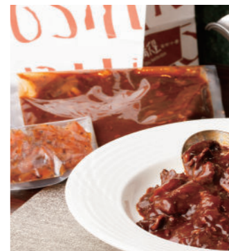
ハヤシソース (2人前) 3,000円