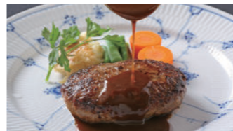
ハンバーグステーキ ドゥミグラス 2,160円