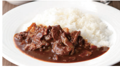
ハヤシライス 2,050円 和牛ハヤシライス 3,240円