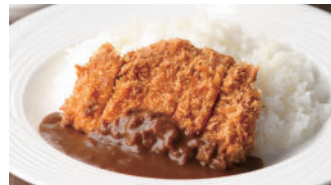
宮崎産南の島豚カツカレー 2,160円