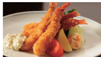
海老フライ タルタルソース 1,940円