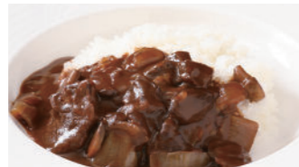
フィレビーフカレー 2,160円