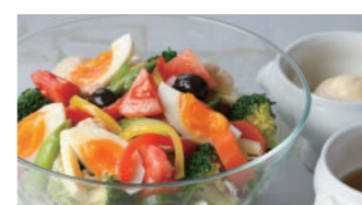
アंकルサラダ (満天星ドレッシング) 1,750円