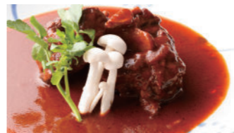
テールシチュー 4,000円