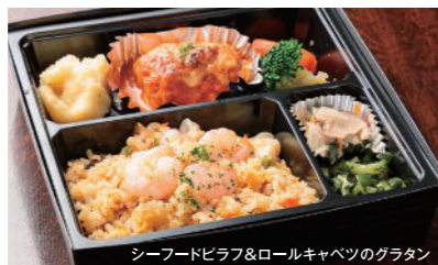
シーフードピラフ&ロールキャベツのグラタン