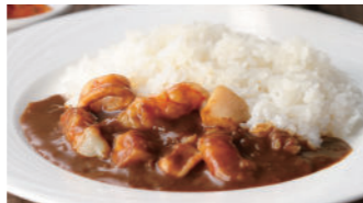
シーフードカレー 1,940円