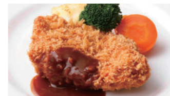
宮崎産南の島豚カツレツ (ロースまたはフィレ) 2,160円