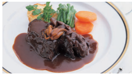
ビーフシチュー (ライス または パン付) 4,100円