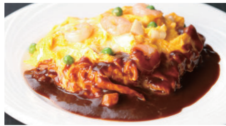
オムレツライス ドゥミグラス 1,940円 (5~9月は衛生の観点より提供中止とさせていただきます)