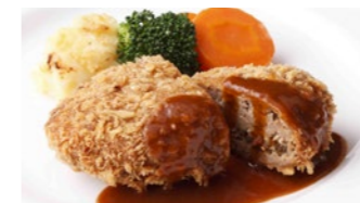
メンチカツ ドゥミグラス 1,940円