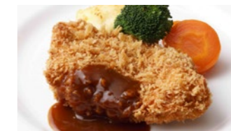
宮崎産南の島豚カツレツ (ロースまたはフィレ) 2,160円