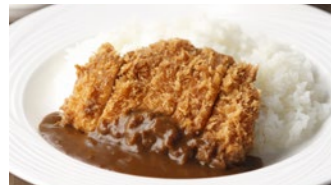
宮崎産南の島豚カツカレー 2,160円