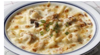
チキンと木の子のマカロニグラタン/ドリア 1,730円