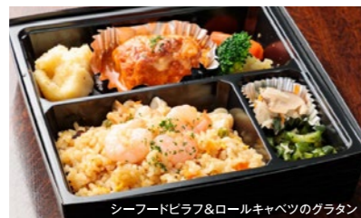
シーフードピラフ&ロールキャベツのグラタン