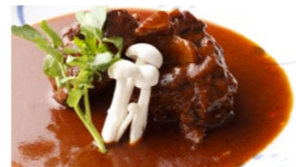
テールシチュー 3,450円