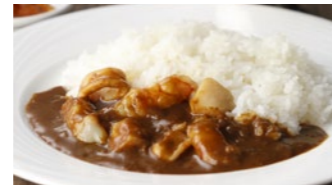
シーフードカレー 1,940円