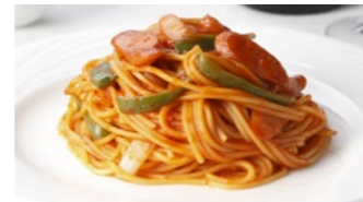
スパゲティ ナポリタン 1,730円