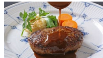
ハンバーグステーキ ドゥミグラス 1,940円