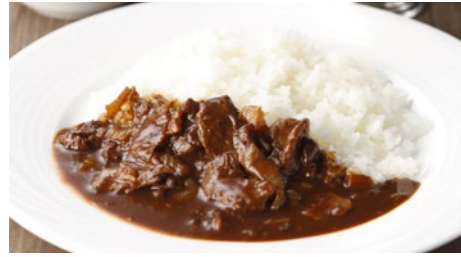
ハヤシライス 1,940円 和牛ハヤシライス 3,240円