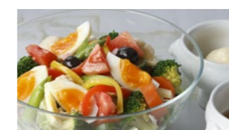
アングルサラダ (マヨネーズ・満天星ドレッシング) 1,750円