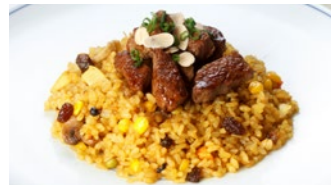
フィレビーフドライカレー 1,940円