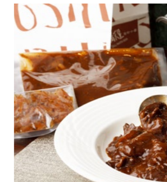
ハヤシソース (2人前) 2,160円