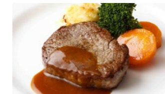
牛フィレステーキ 3,240円 和牛フィレステーキ 9,720円