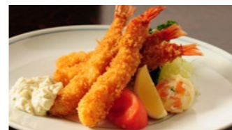
海老フライ タルタルソース 1,940円