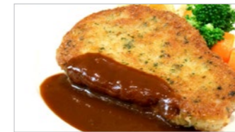
仔牛のカツレツ ミラノ風 2,370円