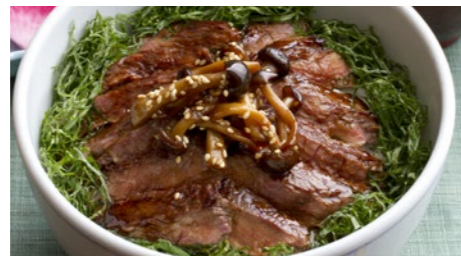
牛テキ井 2,160円 和牛テキ井 5,940円