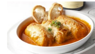
ロールキャベツのグラタン (トマトソース) 1,940円