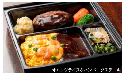
オムレツライス&ハンバーグステーキ