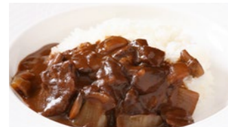
フィレビーフカレー 2,160円