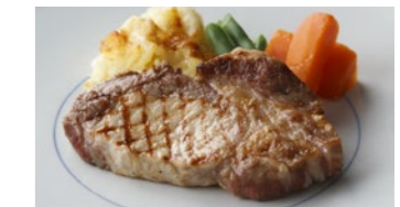
宮崎産南の島豚ロース (網焼き または ソテー) 2,160円