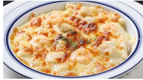
海の幸のマカロニグラタン/ドリア 1,940円