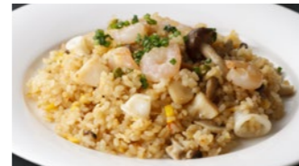
海の幸のピラフ 1,730円