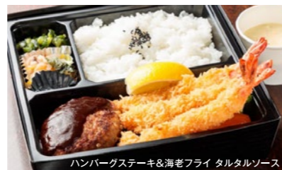
ハンバーグステーキ&海老フライ タルタルソース