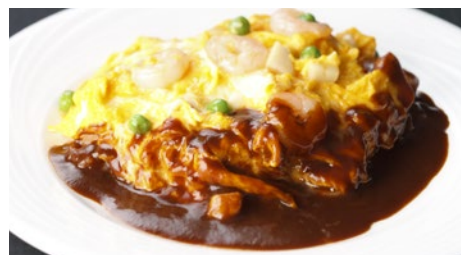
オムレツライス ドゥミグラス 1,940円 (5~9月は衛生の観点より提供中止とさせていただきます)