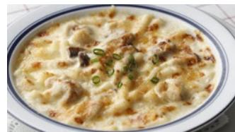
チキンと木の子のマカロニグラタン/ドリア 1,730円