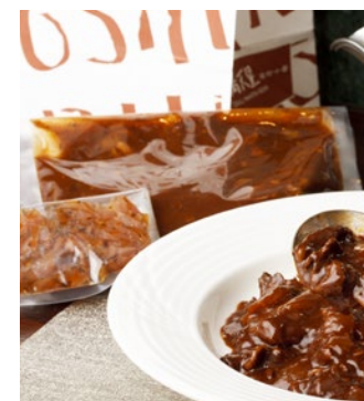
ハヤシソース (2人前) 2,160円