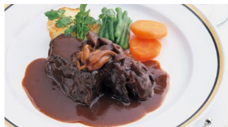
ビーフシチュー (ライス または パン付) 3,670円