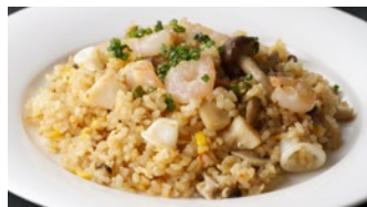
海の幸のピラフ 1,730円