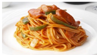
スパゲティ ナポリタン 1,730円