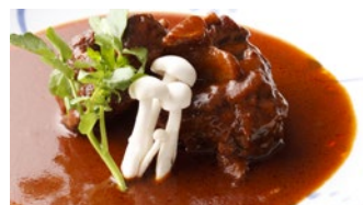
テールシチュー 3,240円