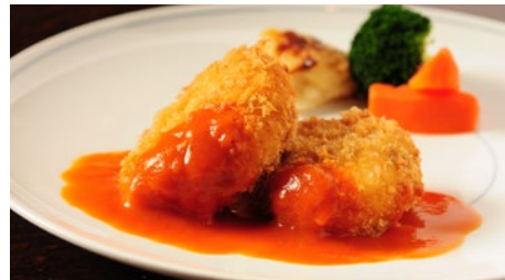
蟹クリームコロッケ 1,730円 たらば蟹クリームコロッケ 2,700円 (ライス または パン付)