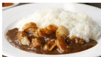
シーフードカレー 1,940円