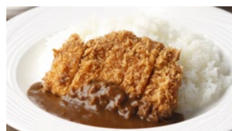
宮崎産南の島豚カツカレー 2,160円