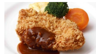
宮崎産南の島豚カツレツ (ロースまたはフィレ) 2,160円