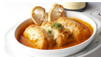
ロールキャベツのグラタン (トマトソース) 1,940円