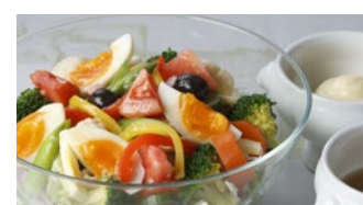
アंकルサラダ (マヨネーズ・満天星ドレッシング) 1,750円