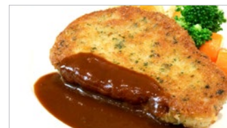
仔牛のカツレツ ミラノ風 2,370円