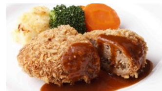
メンチカツ ドゥミグラス 1,940円