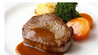
牛フィレステーキ 3,240円 和牛フィレステーキ 9,720円